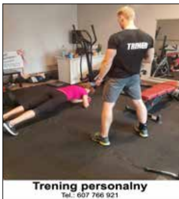
Trening personalny Tel.: 607 766 921

SPRZEDAM. działkę ogrodową POD "Poziomką", z pełnym wyposażeniem, 5 arów z altaną murowaną. Więcej informacji pod tel. 605 072 658